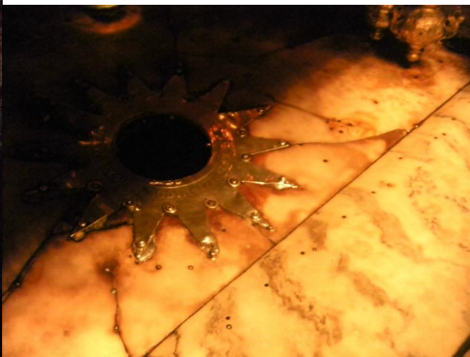
洞里的伯利恒星（大卫之星）

后来跟小花汇合后得知 圣诞教堂 融合了拜占庭、天主教、亚美尼亚 3 个教派，看完马槽和伯利恒星，来到隔壁就是明显的天主教风格了。四周的油画讲述着圣母和圣子的故事，这里没有人在作礼拜，但却有乐声不断传来。