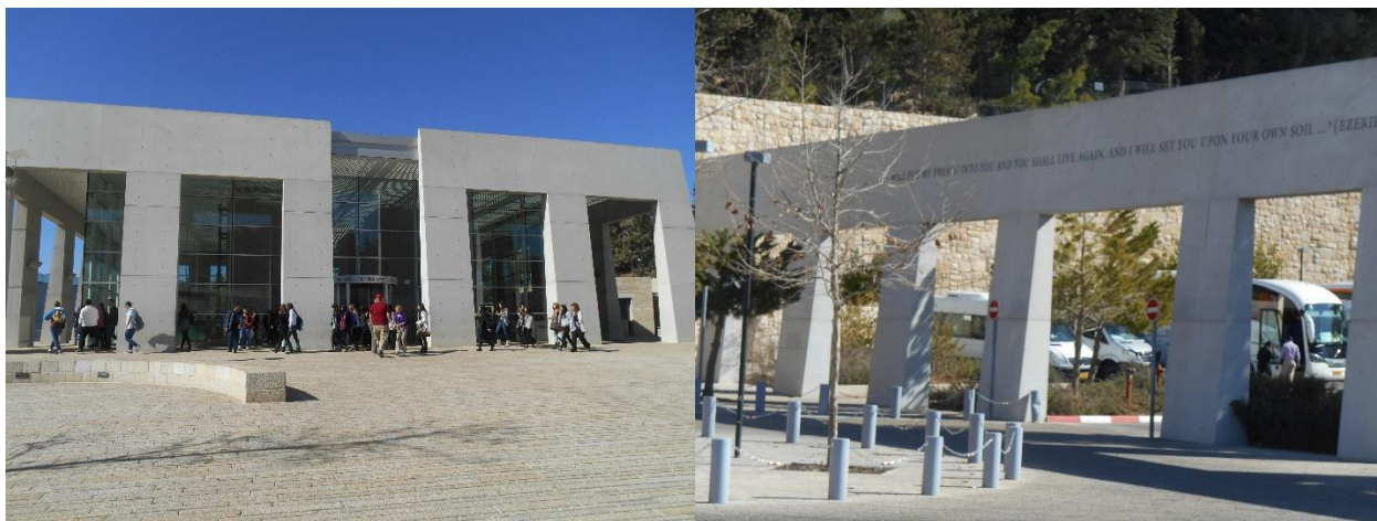
大屠杀纪念馆（名号纪念馆）